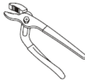
Groove Joint Pliers