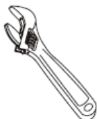
Adjustable Wrench Clé à molette Llave ajustable