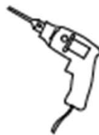
Drill Perceuse Taladro